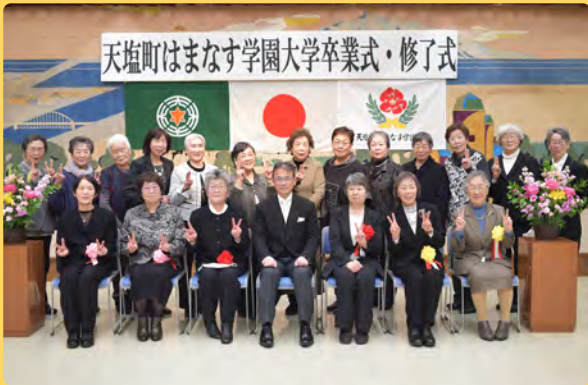
▲卒業・修了された、はまなす学園（高齢者）大学の学生ら

3月7日、令和6年度天塩町はまなす学園大学の卒業・修了式が町福祉会館にて開催され、10名の皆さんが各課程を卒業しました。西村教育長から「大学での学びをきつかけとして趣味や交流を広げたり、健康づくりに取り組まれたり、より一層活躍されることを願っています。また、皆さんがこれまで培った知識や経験を今後の町づくりに生かすためご指導いただきたくお願いします」と式辞を述べました。本年度は入学式をはじめ、福祉会館・歴史資料館前の花壇整備活動、パークゴルフ・フロアカーリング教室、知床への修学旅行、天塩中学校との交流学習、留萌管内での校外学習など計13の履修行事に延べ267人が出席しました。