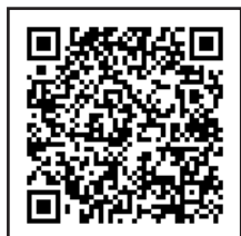
▲消防庁「一般市民向け 応急手当 WEB 講習」

「一般市民向け応急手当WEB講習」をご視聴いただき、一步勇気を踏み出せるきっかけになると幸いです。