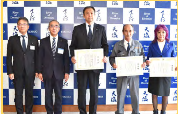
▲（中央から）感謝状を贈呈された堀松建設工業㈱、(右)横溝重機産業 (株)スガイ

2月28日、町の教育・福祉施設の除雪等の地域貢献を行った3社に感謝状が贈呈されました。堀松建設工業(株)は、1月31日と2月4日に啓徳小学校の校舎脇を重機と手作業で除雪を実施。(有)横溝重機産業は1月23日、雄信内へき地保育所の隣接地に重機を用いて除雪を兼ねて遊び場となる雪山すべり台を構築。(株)スガイは12月20日と1月6日に重機を用いて認定こども園「おひさま」のグラウンドの除雪作業を行いました。3社に対し、町の教育振興及び児童福祉施設の環境整備に貢献したことへの感謝の意を評して、西村教育長、野崎副町長より感謝状が贈呈されました。