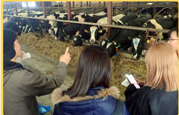
▲酪農経営について説明を受け、意見交換を行う大学生ら

北海道大学の学生5名が3月1日に来町し、2日間にわたり、町内の牧場等を見学する合宿交流会を天塩町営農担い手協議会（事務局・天塩町農林水産課）主催で行いました。来訪した大学生は北海道大学の酪農サークル「にとべこ」に所属する農学部と文学部の2、3年生で初めての来町。町内の複数の牧場を同協議会事務局スタッフ、留萌農業改良普及センター指導員、るもい農業協同組合天塩支所職員らと同行で見学し、酪農経営に関する説明を受け、意見交換を行いました。また、秋に天塩町で実施予定の交流イベントの内容についても関係者と話し合いを行いました。