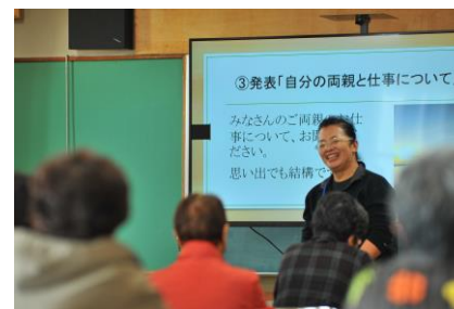
はまなす学園大学での講師