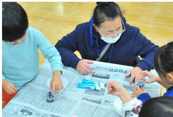
木育支援。「おひさま」園児による クリスマスリースづくり