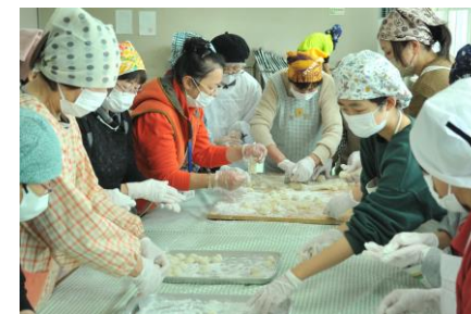
はまなす学園大学「もちつき交流会」支援