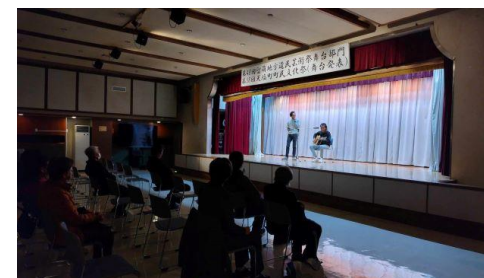
町民文化祭でMCアシスタント支援