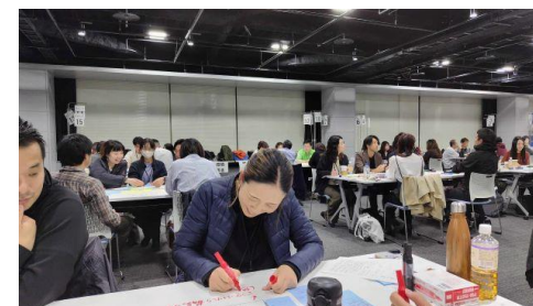
協力隊全道大会でのワークショップ