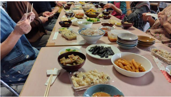
手作りコンニャクで「開拓汁」カラふるの記事はこちら