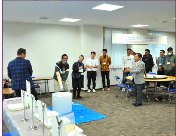
▼餅つき体験を通じて在住外国人との交流会

11月22日、町教育委員会主催による「てしお ほっと！HOT！コンサート」が天塩中学校体育館にて開催され10代から70歳代までの町民45名が来場し鑑賞しました。演奏を行った「Ropossa Saxophone Quartet（ロポッサ・サクソフォン・カルテット）」は札幌を拠点に活動するサクソフォン四重奏4名グループ。ディズニーやジブリなどの馴染み深い作品や演歌モデルなどの曲目を披露したり、4名の奏者が天塩町を訪れた感想や各パートの楽器について語り、交流を行いました。翌23日はメンバー2名が天塩中学校吹奏楽部員6名に演奏指導を行いました。