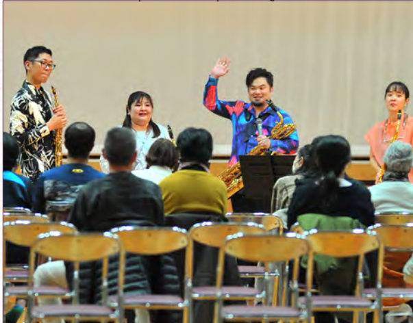
▼演奏会を行った Ropossa Saxophone Quartet のメンバー