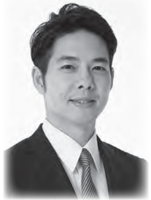
北海道知事 鈴木 直道

新年明けましておめでとうございます。皆様とともに新たな年を迎えられたことを、大変うれしく思います。