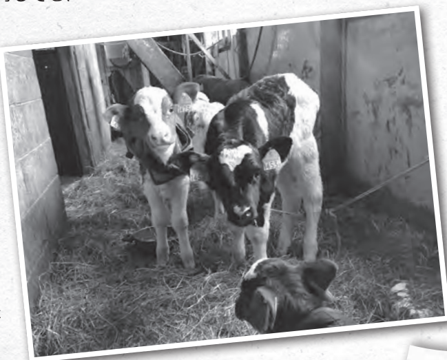
▶吉田家の子牛。「この前生まれた双子は雌同士でホッとしました」