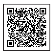
▲收受印の押なつてについてはこちら

おつて、税務行政のデジタル化における手続等の見直しの一環として、令和7年1月から、申告書等の控えに收受日付印の押なつて行わないこととしましたので、書面で申告書等を提出される場合には、必要に応じて、ご自身で控えの作成及び保有、提出年月日の記録・管理をお願いします。