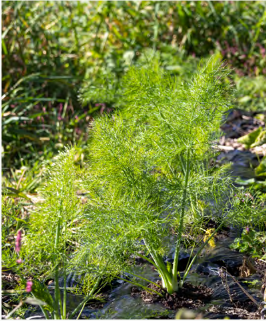
町内の農園で農作物の栽培知識を習得