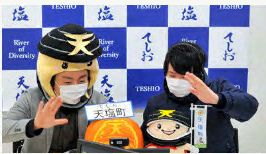
NHK「北海道スタジアム（秋ノ陣）」に初出演