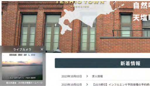
天塩町公式ウェブサイト上にライブカメラを設置