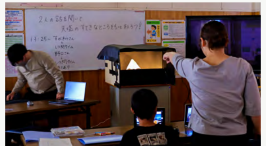
啓徳小学校で天塩の夕日について説明するために夕景のシミュレーターを制作