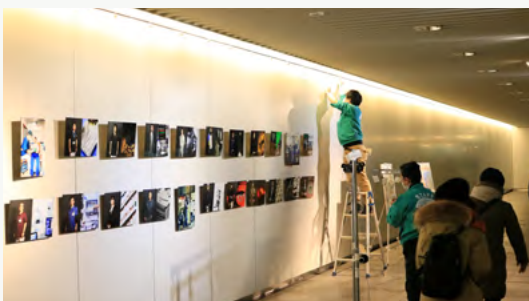
札幌にて天塩出身の写真家の作品を展示