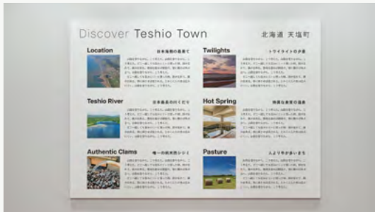
PR イベント等で使用する天塩町紹介パネルを制作