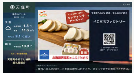
多言語対応デジタルサイネージプログラムを制作