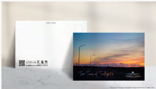
PR イベント等で使用するポストカードを制作