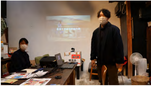
島根県松江市の協力隊と今後の連携に向けて意見を交換