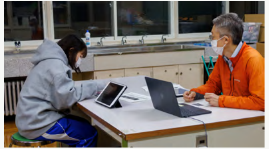
天塩高生のチームに生成 AI を用いた特産品のイメージ画像作成手法を紹介