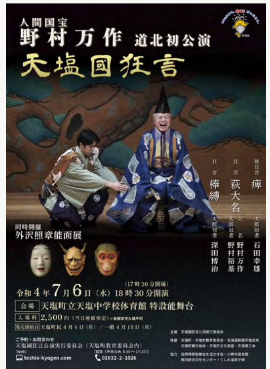
「天塩國狂言」公演ポスターを制作