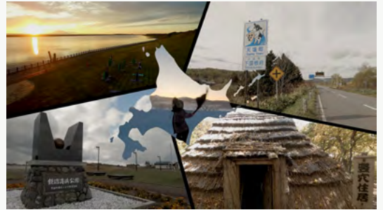
NHK「ほっとニュース道北・オホーツク」への提供動画を制作