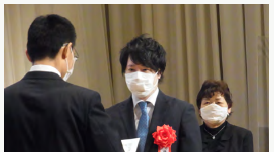
北海道農政事務所・動画コンテスト授賞式に出席