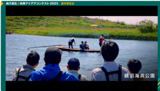
内閣府「地方創生☆政策アイデアコンテスト」の地域 PR 映像を制作