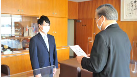
天塩町地域おこし協力隊に着任

3年間を通して、天塩高校の授業（総合的な探求の時間・高大連携教育）や啓徳小学校での放課後学習サポートに関わる活動を行いました。そのほか、特に印象的だった活動を以下にいくつかピックアップしました。