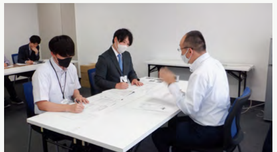
経営知識の獲得と中小企業診断士の登録を目指し札幌市での研修を開始