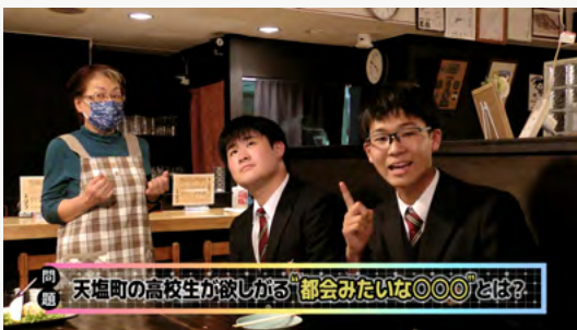
NHK「179Q」へ提供した天塩町にまつわるクイズ