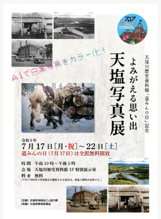
「よみがえる思い出・天塩写真展」ポスターを制作