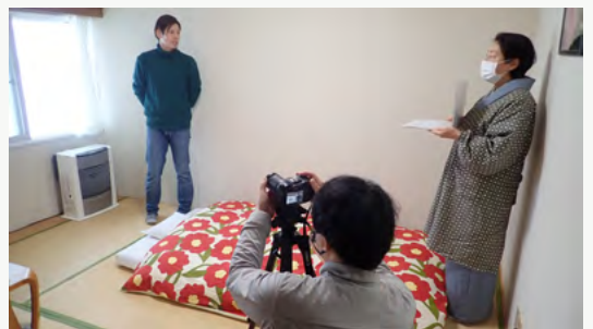
在アンカレジ領事事務所主催の日本・アラスカ姉妹都市の文化紹介イベント用映像を制作