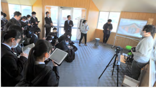
改装した天塩高校前バス待合所を学生に紹介