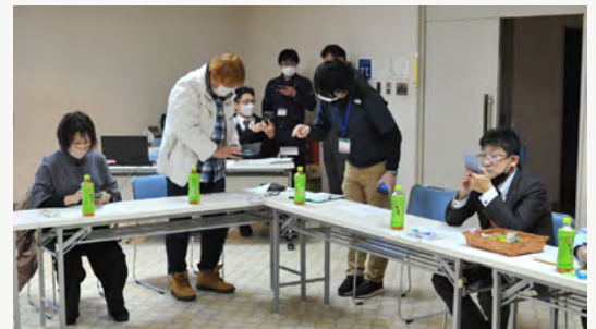
翻訳アプリ活用の研修会へ参加