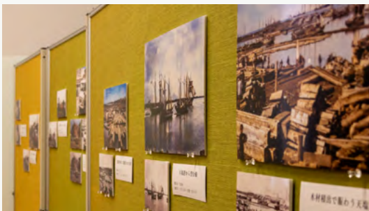
天塩の古い白黒写真をAIを活用してカラー化し「よみがえる思い出・天塩写真展」にて展示