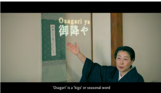
「日アラスカ姉妹都市・お国自慢フェスタ」にて天塩町有志チームの作品が1位を獲得