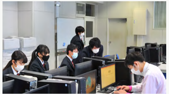
天塩高校でスライドデザインの授業を実施