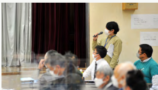
天塩かわまちづくり検討会でプレゼン