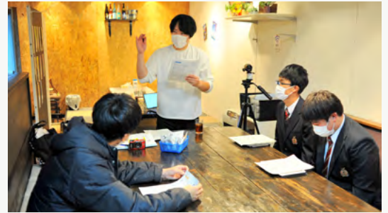
NHK「179Q」に提供する動画を天塩高生と制作