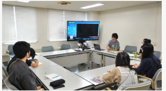
北海学園大・留萌振興局による地域課題解決の取組事業で活動を紹介