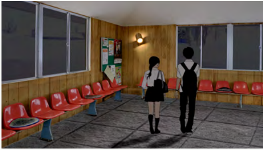
天塩高校前バス待合所改装イメージを制作