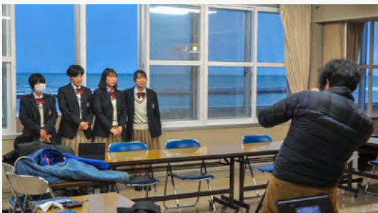
内閣府「地方創生☆政策アイデアコンテスト」に向けて天塩高生チームの意気込み映像を撮影