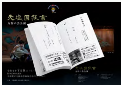
「天塩國狂言」公演に向け、ポスターや冊子類・オンライン予約システムを制作