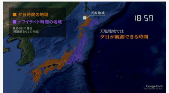
筑波大院生による天塩の夕日・トワイライト景観の研究内容を紹介する動画を制作