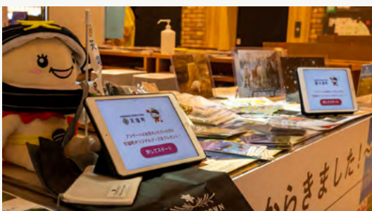
地域PRイベントで利用するタブレット用アンケートアプリを開発