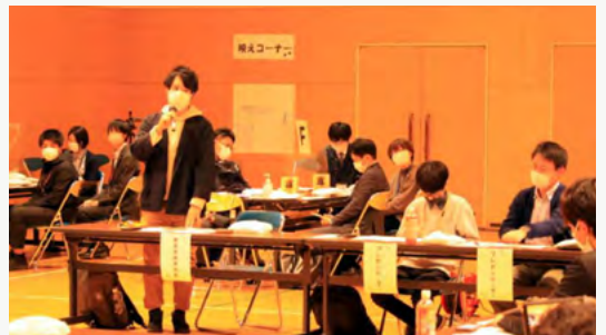
北海道チャレンジピッチ in るもいに参加