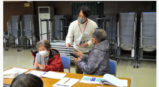
高齢者向けスマホ教室へ参加