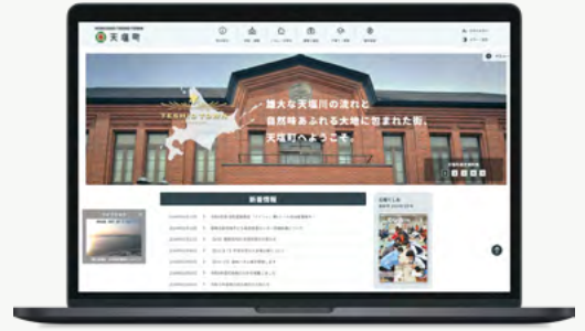
天塩町公式ウェブサイト（モバイル端末対応）のデザインを制作