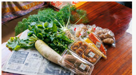
天塩町公認インスタグラマーに食材を提供