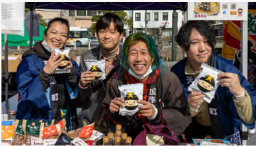
松江市のイベントで天塩の特産品を販売