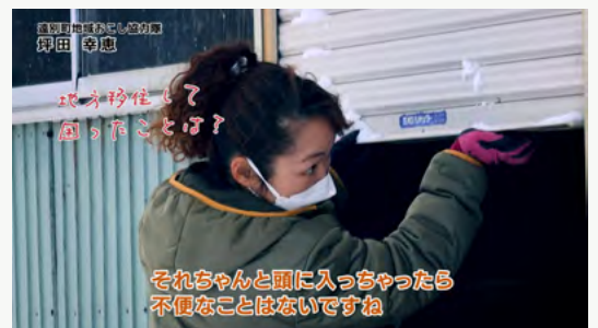
留萌管内協力隊共同出展イベントでのPR用活動紹介映像を制作