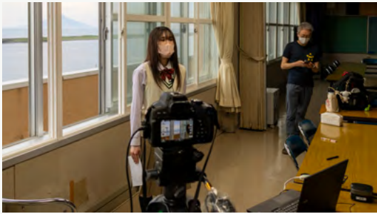
北星学園大でのプレゼンに向けて天塩高生による発表映像を収録