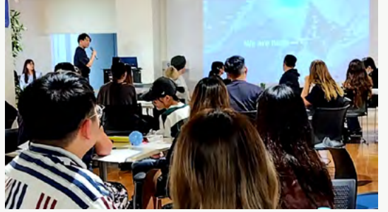
北星学園大で豪マードック大学の学生に向けて天塩の魅力や観光資源について発表