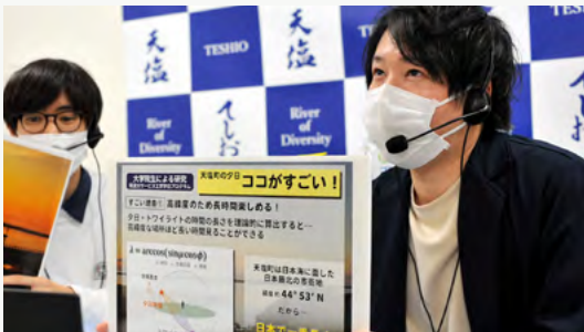
NHK「北海道スタジアム」生放送で天塩の夕日景観について紹介